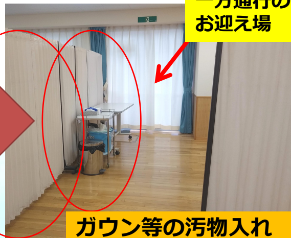
ガウン等の汚物入れ消毒等置き場