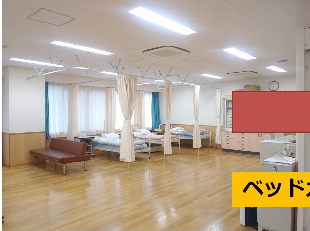
ベッドカーテン・パーティションで区切り